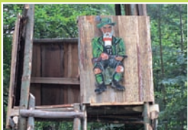
D. Der Hochsitz – sieh die Welt aus der Vogelperspektive