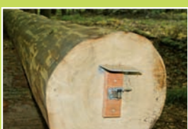
H. Der Klangbaum – lausche dem mit 22 m längsten Musikinstrument Kleinwallstadts