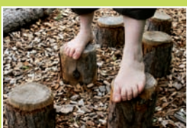
G. Die Holzpflocke – Balancieren nicht nur für Artisten