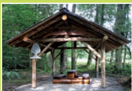
E. Die Schutzhütte – ein schöner Platz zum Ausruhen und Verweilen