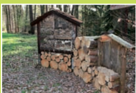
F. Das Insektenhaus – Holz und Lehm von Menschen als Heimat für Insekten