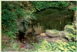
B. Das Biotop – erkenne Lebensraum über und unter Wasser