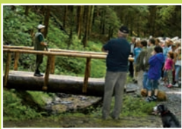
A. Die Holzbrücke – gebaut für Mensch und Tier