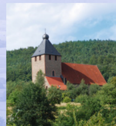
Die neue Wendelinuskirche in Eichenberg