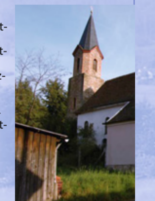
Die alte Wendelinuskirche (2009)