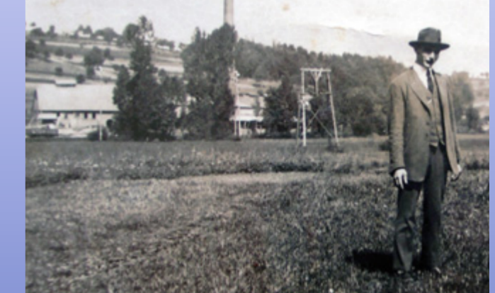
Eine der wenigen Aufnahmen, auf denen (hier links hinter der Person) zumindest ein Stützpfiler der Materialseilbahn zwischen Eichenberg und Sailauf zu sehen ist.

Bei diesem Kulturweg stehen »Apfelwein« für Blankenbach mit Erlenbach und »Weißer Stein« für Eichenberg. Blankenbach und Eichenberg waren 1899–1936 mit einer Materialseilbahn verbunden. Dolomit aus dem Steinbruch Eichenberg wurde im Kalkwerk Großblankenbach zu Kalk gebrannt. Der Kulturweg folgt den Spuren dieser historischen Verbindung und präsentiert dabei die Besonderheiten der beiden Dörfer. Hinzu tritt Erlenbach als Blankenbacher Ortsteil mit dem Ensemble von Kapelle und Brunnen. Der Hauptort war einst geteilt von der Kahl in Groß- und Kleinblankenbach, die getrennten Territorien angehörten. Der aus Blankenbacher Keltereien gekelterte Apfelwein war und ist im Rhein-Main-Raum geschätzt und bekannt. Für Eichenberg charakteristisch (und teilweise auch für Blankenbach) sind die Gebäude aus weißem Buntsandstein, der aus dem »Weißer Steinbruch« stammt. Darüber hinaus wurden in Eichenberg auch unter Tage Schwespat und Mangan abgebaut und nach Sailauf transportiert, zu dem Eichenberg heute gehört. Für Liebhaber weiter Ausblicke sind die beiden Panoramatafeln »Kahlgrund« und »Aschafftal« zu empfehlen.