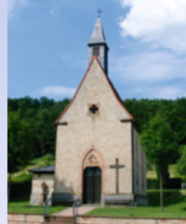
Die Kapelle in Eichenberg

Bitte folgen Sie dem Zeichen des gelben EU-Schiffchens auf blauem Grund.