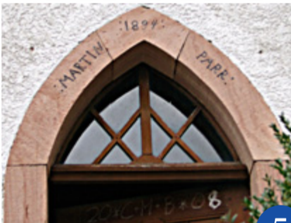
Detail der Erlenbacher Kapelle

Erlenbach erscheint in den Schriftquellen erstmals in der zweiten Hälfte des 13. Jahrhunderts. Damals befand sich auf dieser Gemarkung vermutlich nur ein einziger Hof mit dazugehörigen Feldern. Prägend für den Weiler ist die Kapelle oberhalb des Dorfbrunnens. In der Nähe stand am Fluss Kahl die so genannte »Flederichsmühle«. In den 1980er Jahren wurde das baufällig gewordene Haus abgetragen und im Freilichtmuseum Bad Windsheim neu aufgebaut.