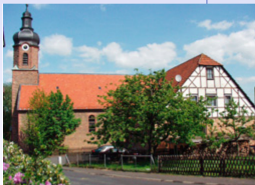
Die Blankenbacher Kirche mit der ehemaligen Schule