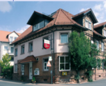
Ein zweiter Startpunkt des Kulturweges befindet sich am Blankenbacher Bahnhof neben dem Hotel Brennhaus Behl (ehemaliger Gasthof »Zur Linde«).

Mit der Eröffnung der Kahlgrundbahn im Jahr 1898 erfuhr der Kahlgrund einen bedeutenden Aufschwung. Zum einen durch eine bessere Verkehrsbindung in das Rhein-Main Gebiet, zum anderen diente die Bahn als Transportmittel für Obst und Kalk aus dem Werk in Großblankenbach. In der Umgebung von Blankenbach findet man heute noch zahlreiche Streuobstwiesen – Ursprung des Kahlgründer Apfelweins, der bis in den Frankfurter Raum bekannt ist.