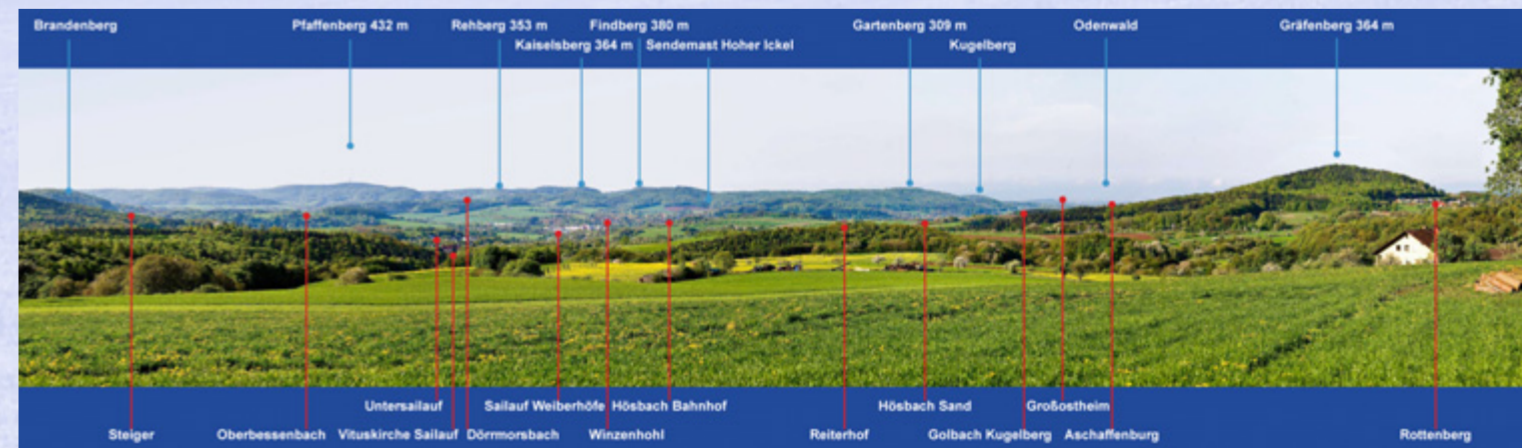
Panorama Aschafftal (Station 9)