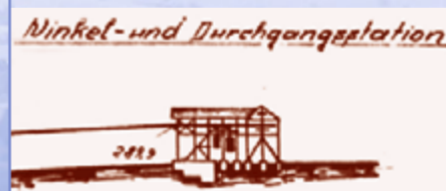
Eine Skizze ist der einzige Hinweis auf das Aussehen der Winkelstation.

In einem Steinbruch an der Eichenberger Kuppe wurde Dolomit abgebaut und dann mit der Seilbahn zum Blankenbacher Kalkwerk befördert. Dort wurde der Dolomit schließlich gebrochen und im Ofen zu Brantkalk gebrannt, der zur Herstellung von Mörtel zum Mauern weiterverarbeitet wurde. Die Seilbahn führte über ein Gefälle von 114 Höhenmetern über die »Winkelstation« zum Kalkwerk Blankenbach. In der »Winkelstation«, von der heute nur noch Überreste des Fundaments zu sehen sind, wurden die beiden Zweigtrassen von Sommerkahl und Eichenberg für den Weitertransport nach Blankenbach zusammengeführt.