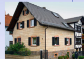
Der weiße Sandstein vermauert in Blankenbach (oben) und Eichenberg (unten)