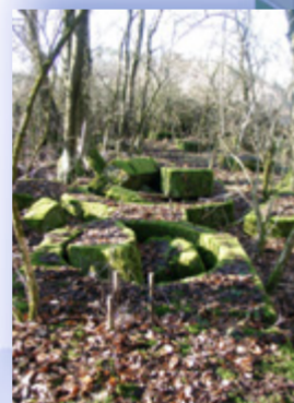
Die Fundamente der Winkelstation