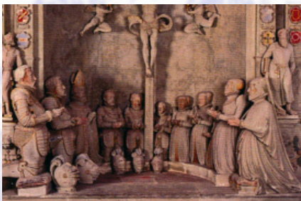
Das 7,4 m hohe Echterepitaph (1583) beherrscht den Chor der alten Wallfahrtskirche.