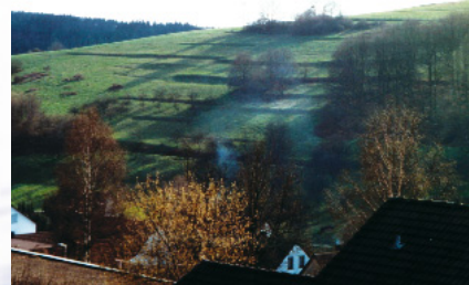
Die ehemaligen Ackerbegrenzungen sind heute am besten bei tiefstehender Sonne zu erkennen.