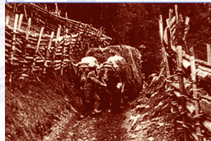
Auf diesem Foto sind die typischen Zäune abgebildet, wie sie über Jahrhunderte im Spessart an Waldrändern und um die Dörfer angelegt waren.

Die im späten Mittelalter übliche Siedlungsform ist das Waldhufendorf, wie hier in Hessenthal. Dabei wurden von den Lehnsherrn für Höfe, die im Tal entlang des Baches aufgereiht waren, Flurstreifen vom Talboden bis auf den Bergkamm vergeben. Am Wagnerstor befinden wir uns am oberen Rand eines solchen Streifengutes. Die Streifengüter waren bewaldet und mussten von den Kolonisten gerodet und für den Ackerbau nutzbar gemacht werden. Hier entstanden dann die heute noch sichtbaren Ackerterrassen. Durch den stetigen Rückgang der Landwirtschaft seit den 1960er Jahren sind die Ackerflächen vielfach Wiesen mit und ohne Streuobst-anbau gewichen. Da keine intensive Bodennutzung mehr betrieben wird, verbuschen die Flächen und verwandeln sich nach einigen Jahrzehnten in Wald. Nur durch permanente Landschaftspflege kann verhindert werden, dass der Spessart wieder zuwächst. Am Wagnerstor befand sich ein Durchgang zwischen den Wildzäunen, die die Äcker vor den Waldtieren sicherten.