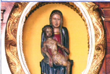
Das Gnadenbild von Hessenthal stammt aus dem 15. Jahrhundert.

Die Wallfahrt nach Hessenthal ist seit 1293 urkundlich nachweisbar. Aus diesem Jahr stammt eine Ablassurkunde des Mainzer Erzbischofs Gerhard II. Die Hessenthaler Wallfahrt war die politische Antwort der Erzbischöfe von Mainz auf das rieneckische Kloster Himmelthal bei Eschau am Unterlauf der Elsava. Ablässe aus Rom und Wunderberichte hielten die Wallfahrt nach Hessenthal über die Jahrhunderte lebendig. Die Hessenthaler Kirchenburg besteht aus drei Gotteshäusern: Der neuen großen Wallfahrts- und Pfarrkirche, der kleineren alten Wallfahrtskirche und der Gnadenkapelle. In der alten Wallfahrtskirche ist die Grablege der Echter von Mespelbrunn bis 1600 zu sehen. In der Gnadenkapelle steht das Bild der schmerzhaften Muttergottes von Hessenthal. In der neuen Wallfahrtskirche fanden die zwei großen Kunstwerke Hessenthals eine würdige Aufstellung: die Kreuzigungsgruppe von Hans Backoffen (1519) und die Beweinungsgruppe von Tilman Riemenschneider (1485).