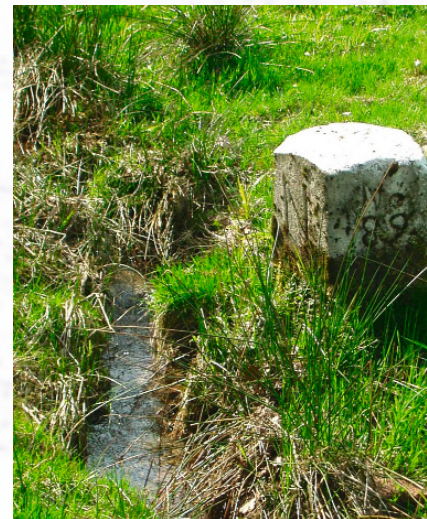
Am Dreimärker im Langen Grund stoßen die Gemarkungen von Mespelbrunn (Neudorf), Hessenthal und der Stadt Aschaffenburg zusammen. Bild rechts: Eine podestartige Lesesteinsammlung gewaltigen Ausmaßes erhebt sich am Hang des Langen Grundes. Das Gewicht dieses kleinen Steinberges wird auf 25 t geschätzt.