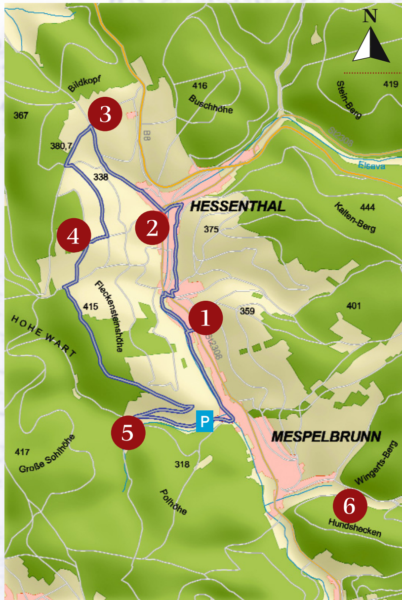
Weglänge ca. 8 km