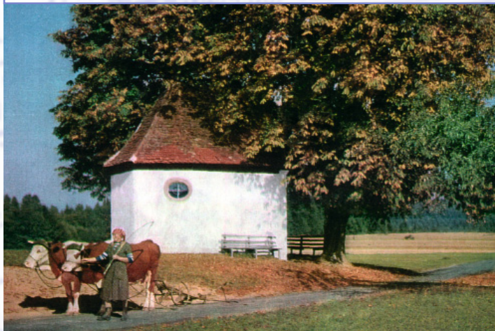
Der letzte Umbau der Herrnbildkapelle in die heutige Form datiert in das Jahr 1670.

Über die Hessenthaler Wallfahrt erzählt man sich die Legende von einem Köhler und einem Rittersmann, der unabsichtlich mit seinem Schwert ein Bild der Muttergottes mit dem Jesuskind auf dem Arm traf, das darauf zu bluten begann. Seither tragen die Hessenthaler jedes Jahr an Pfingstmontag das Gnadenbild in feierlicher Prozession auf den Berg zur Herrnbildkapelle. Die Herrnbildkapelle liegt an einer äußerst verkehrsgünstigen Stelle an der Einmündung des frühmittelalterlichen »Salzweges« von Worms kommend in die »via publica«, die über Lengfurt nach Würzburg führte. Kapellen sind im Spessart oftmals an Verkehrsknotenpunkten vorzufinden, wie z. B. die Kreuzkapelle bei Frammersbach. Sie wurden früher als »Meeting-Point« benutzt und entsprechen damit gar nicht unserer modernen Vorstellung von Kapellen als einsam gelegenen Idyllen. Gleich hier in der Nähe liegt die Poststation, an der Wilhelm Hauff Halt machte, wodurch er sich zu seinen Erzählungen im »Wirtshaus im Spessart« inspirieren ließ.