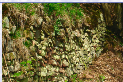
Die Trockenmauern im Langen Grund geben einen Eindruck von dem ungeheuren Aufwand, der betrieben wurde, um ebene Ackerfläche an Steilhängen zu gewinnen.

The cultural pathway (8 km long) leads from the »Haus des Gastes« along the Elsava to the pilgrimage church of Hessenthal. Upslope along the way of the cross to the station called »Herrnbild« is reached, and from there Wagner's Gate (Wagnerstor). Descending along the valley called Langer Grund (long valley/bottom) the way leads back to its starting point. Please follow the markers with the yellow-on-blue EU boat. A separate poster recalls the history of Mespelbrunn Castle.