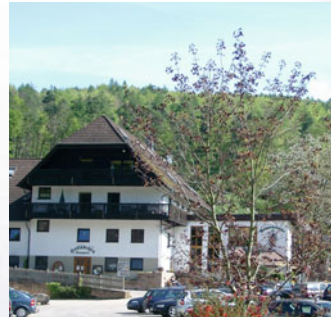
Das Ausflugsziel Waldmichelbacher Hof liegt in einem Seitental des Bessenbachs.