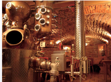
Das Kellergewölbe lädt ein zum Kosten der hauseigenen Brennereierzeugnisse.