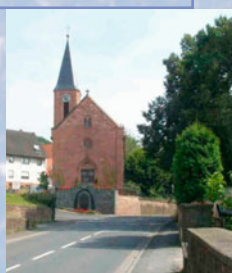
Die Wendelinuskirche thront am südlichen Ortsende über der Hauptstraße.