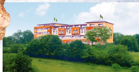
Das Landhotel Klingerhof wird 2008/09 komplett umgestaltet.