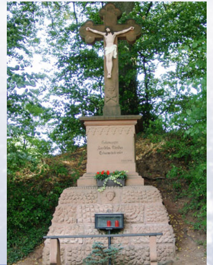
An der Stelle des Eremitagekreuzes befand sich im 18. Jahrhundert eine kleine Einsiedelei.