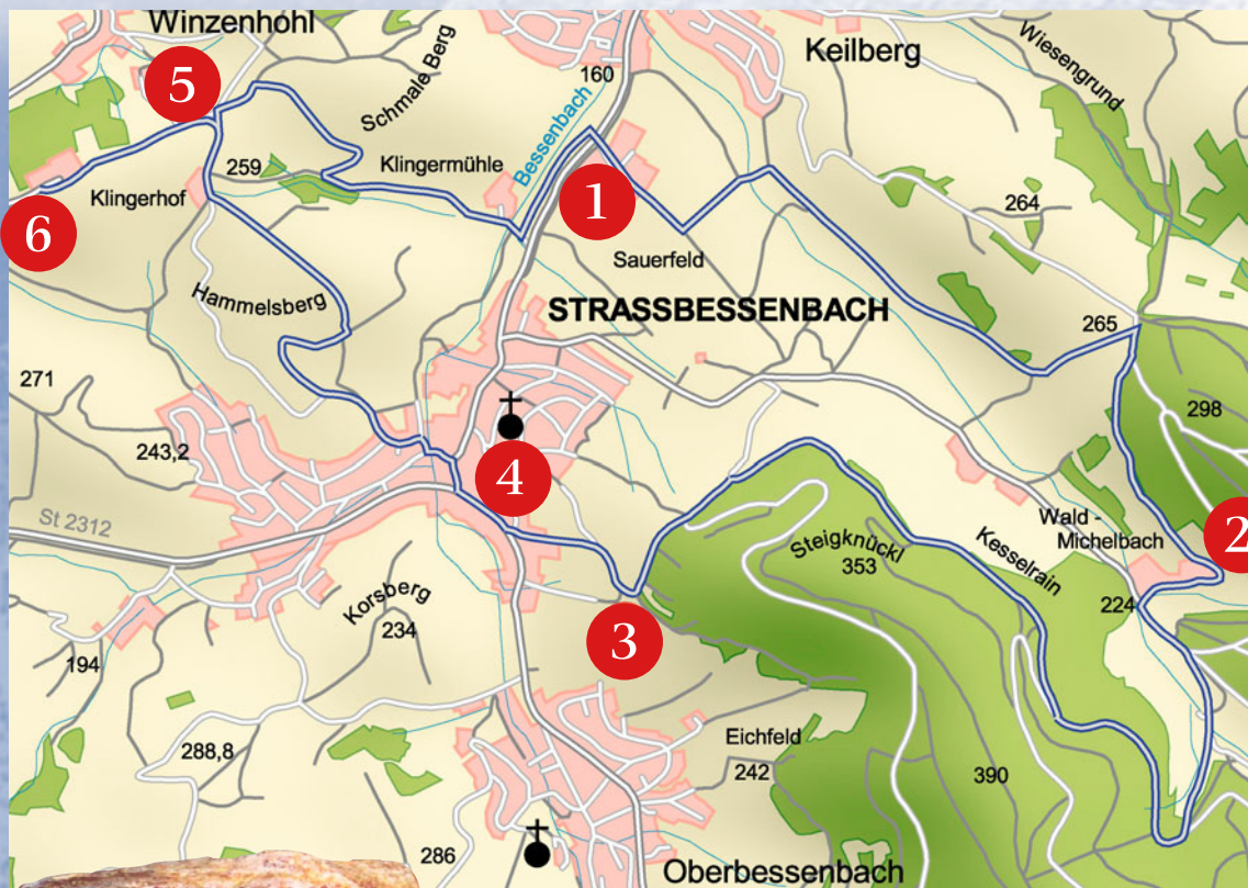
Weglänge ca. 11 km