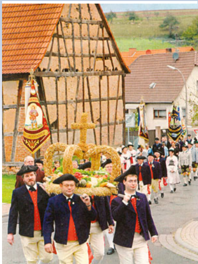
Kirchenparade der »D'Bessenbachthaler« zum Erntedankfest im Jahr 2006