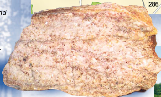
Bruchstück eines weißen Marmors mit kleinen Glimmerschüppchen aus dem Steinbruch unterhalb des Klingerhofs