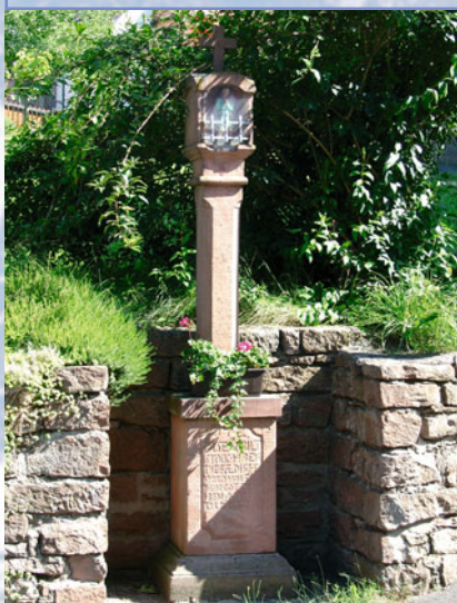
Von der Kirche aus auf der gegenüber liegenden Seite der alten Poststraße steht der Wendelinus-Bildstock, der 1742 von der Familie Vöth aus Esselbach gestiftet wurde.

Das Zentrum Strassbessenbach erstreckte sich entlang der alten Poststraße zwischen Kirche und Wirtshaus. Hier befanden sich die Schule, ein zweites Wirtshaus und eine Brauerei. Das große gastronomische Angebot erklärt sich aus der verkehrsgünstigen Lage, die allerdings zu Kriegszeiten Soldatendurchzüge mit sich brachte, von denen die Napoleonischen am schlimmsten wüteten. Aus den Gastronomiebetrieben gingen im 19. Jahrhundert einige Männer hervor, die bayerische Landtagsabgeordnete wurden und die sich von München aus für das Wohl ihrer Spessarth Heimat erfolgreich einsetzten.