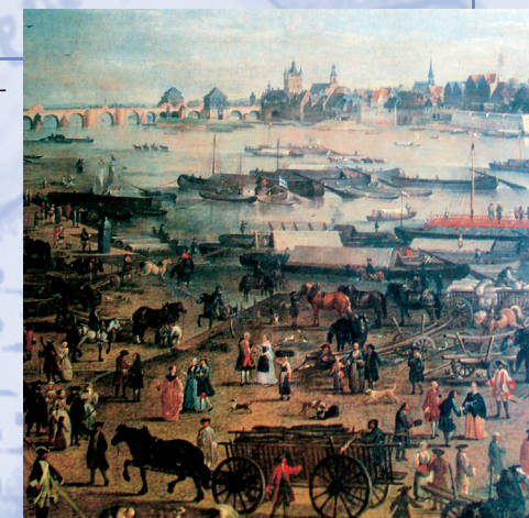
Schiffsbe- und -entladung am Mainufer während der Frankfurter Messe (18. Jahrhundert).

Auf der Trasse Aschaffenburg-Lohr war Glas seit dem Mittelalter eine wichtige Handelsware. Es erscheint im Zolltarif von Frankfurt im Jahre 1329. Vor allem Trinkgläser wurden im Spessart produziert. Das meiste Glas wurde weiter nach Köln und in die Niederlande transportiert. Die Hauptspediteure zwischen dem 15. und dem 17. Jahrhundert waren die Frammersbacher Fuhrleute.