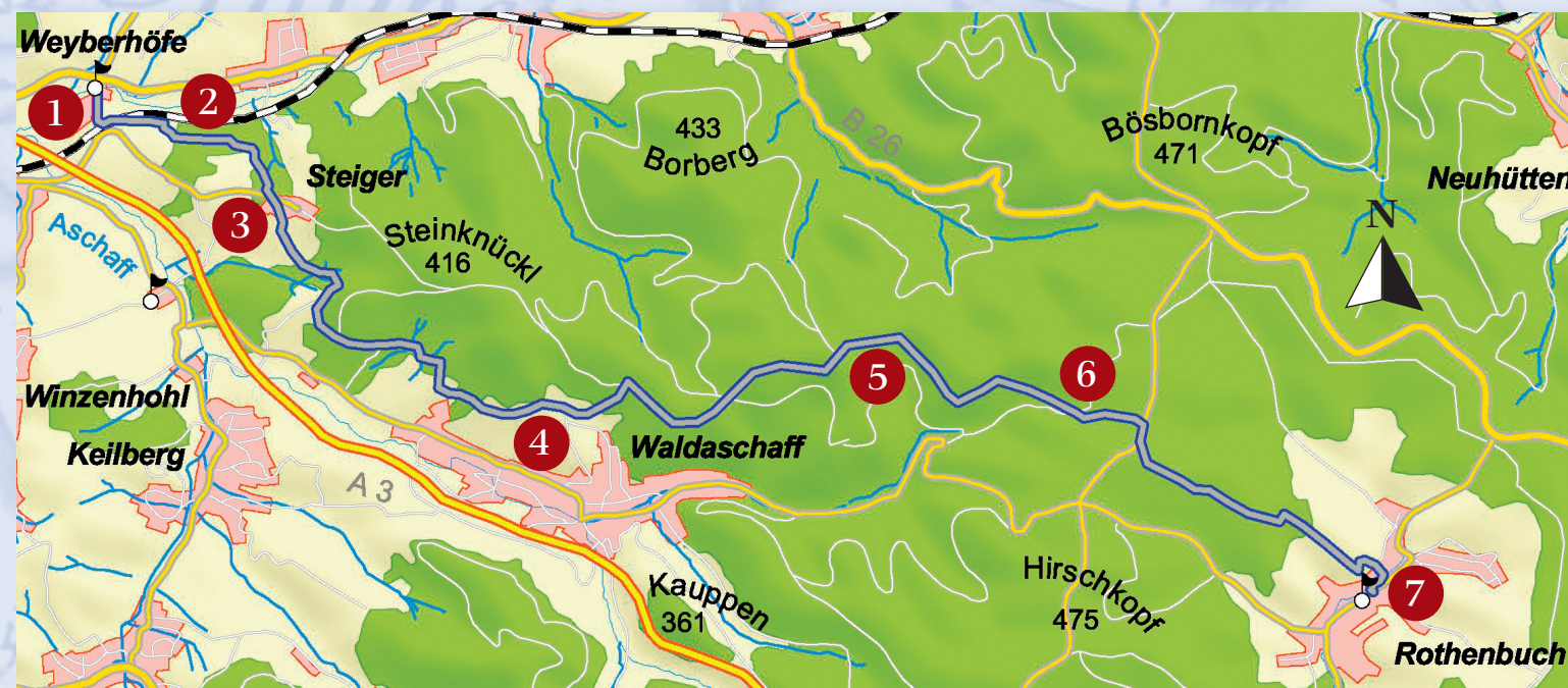
Weglänge ca. 15 km