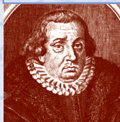
Die Weyberhöfe und das Schloss Rothenbuch wurden vom Mainzer Erzbischof und Kurfürsten Daniel Brendel von Homburg (1523-1582, Erzbischof seit 1555) erbaut bzw. erneuert.