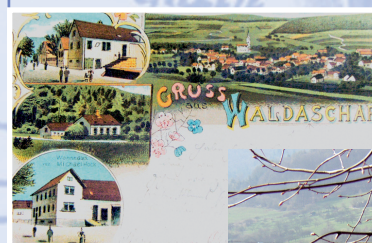
Tourismus in Waldaschaff – Postkarte vom Beginn des 20. Jahrhunderts. Rechts: Blick auf Waldaschaff mit der Kauppenbrücke.

Der Ursprung Waldaschaffs liegt bei dem Burgstall »Wahlmich« in der Nähe des Schlosschens Weiler. Dort saßen die Herren von Weiler, die Lehen sowohl von Mainz als auch von Rieneck besaßen. Wirtschaftliche Zentren waren der Hocken- und der Dietzenhof sowie das so genannte Hofhaus, das in der Dorfmitte stand und der Forstverwaltung diente. In der Neuzeit prägten ein Eisenhammer, Bergbau sowie die Trift von Brennholz das Ortsbild. Sehenswert ist das deutsche Medaillenmuseum. Die Nähe zu einer bedeutenden Verkehrsader bleibt Waldaschaff gestern wie heute: früher war es der Fürstenweg, heute ist es die Autobahn A 3.