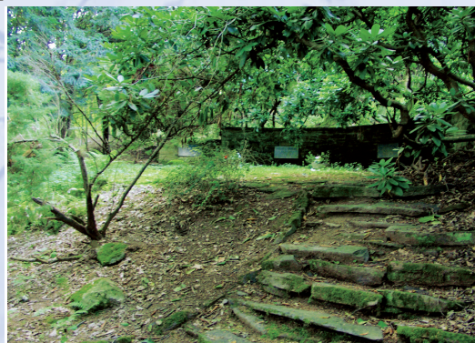
Die Grabstätte von Cancrin liegt stimmungsvoll in einem Hain.

Le chemin culturel (d'une longueur de 15 km) vous mène des Weyberhöfe devant la sépulture de la famille noble de Cancrin, d'où il monte vers Steiger. Au-dessus de Waldaschaff, la route se continue dans la forêt, passe devant la station »Grande route marchande vers la Foire de Francfort« et devant celle de »Croisement de routes marchandes«, et puis descend vers Rothenbuch. Suivez le marquage du bateau jaune de l'Union européenne sur fond bleu.