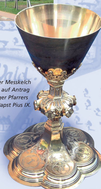
Der Steigerer Messkelch wurde 1877 auf Antrag des Keilberger Pfarrers Bauer von Papst Pius IX. gestiftet.