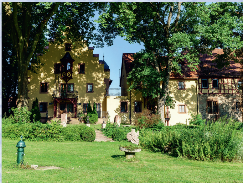
Das Schlosshotel Weyberhöfe, vom Garten aus gesehen

N Im Hintergrund auf dieser Seite: Die Kellersche Forstkarte von 1769