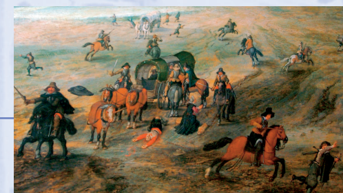
Überfall auf Fuhrleute (flämisch, 17. Jahrhundert)