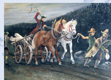
Im Jahre 1811 versuchten einige Waldaschaffer (vergeblich), das so genannte Posthalterkreuz aus dem Wald bei Oberbessenbach nach Waldaschaff zu verbringen. Daher stammt der Spitzname »Herrgottsdiebe« für die Waldaschaffer.