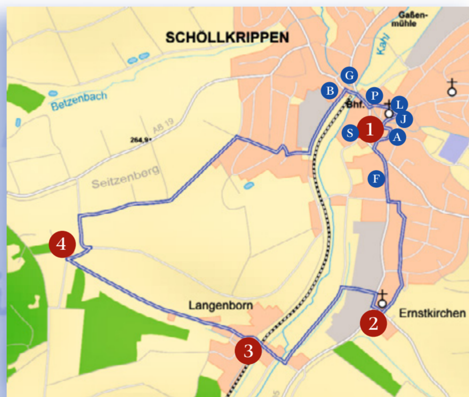
Weglänge: ca. 4 km, bei Abkürzung auf dem Mühlweg zwischen Langenborn und Bahnhof: 3 km