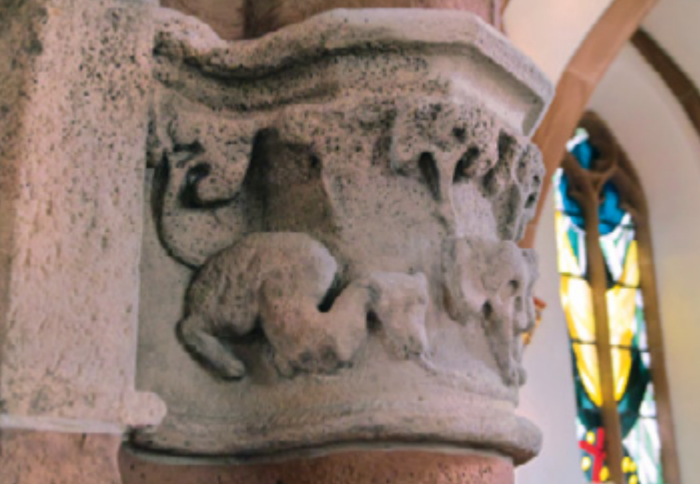
Säulenkapitell mit Lindenblatt und Drachendarstellung in St. Katharina