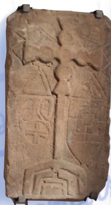
Der mittelalterliche Bildstein in St. Katharina, gefunden bei der Renovierung 1958

Der Ortsteil Langenborn geht aus einem Hofgut mit dazugehöriger Mühle hervor. Im frühen 20. Jahrhundert entwickelte sich hier aufgrund der geologischen Situation und dem Bau der Kahlgrundbahn ein Standort der Kalksteinindustrie, der bis in die 1960er Jahre bestand.