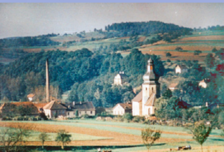
Auf dem Foto der 1960er Jahre ist im Vordergrund Ernstkirchen, links daneben das Kalkwerk mit Kamin und im Hintergrund die Villa Sattelberg zu sehen, heute Landgasthof »Villa Hof Langenborn«.